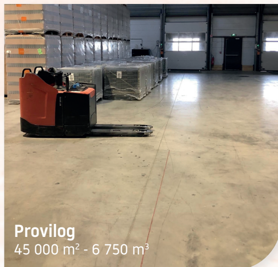
Provilog 45 000 m 2 - 6 750 m 3