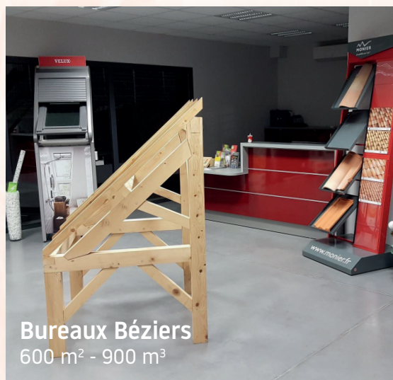
Bureaux Béziers 600 m 2 - 900 m 3