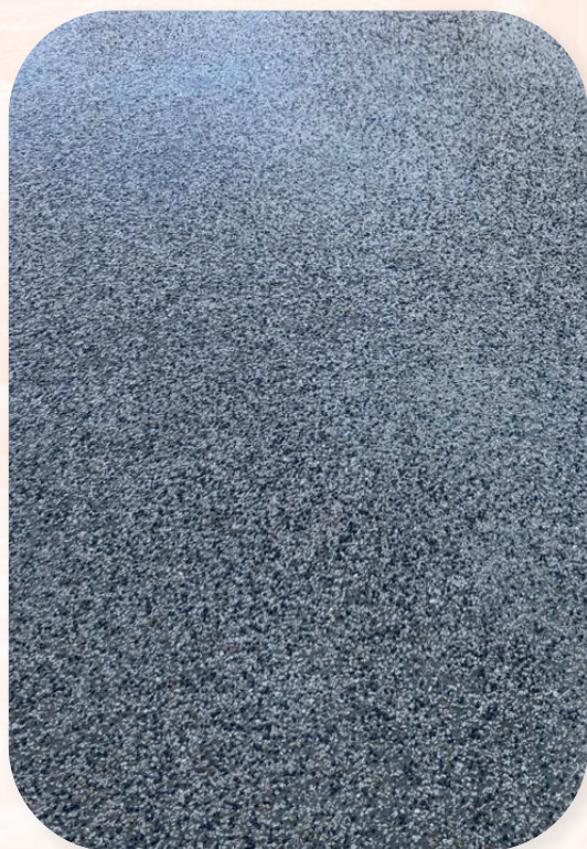
Cheminement piéton Narbonne (11)

Écologique, son large choix de granulats, de teintes, de granulométrie vous permettra de créer avec d'innombrables possibilités la ou les circulations que vous aurez préalablement imaginées.