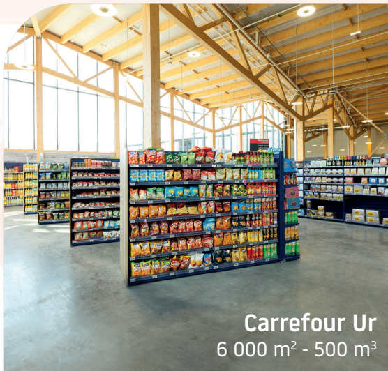
Carrefour Ur 6 000 m 2 - 500 m 3