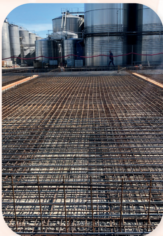
Cave Coopérative Puilacher 2 000 m 2