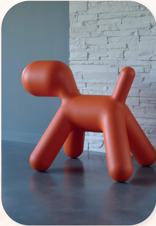
Maison d'habitation Béziers (34)