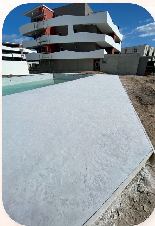
Résidence le Grand Large Sérignan (34)