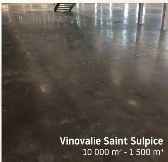
Vinovallie Saint Sulpice 10 000 m 2 - 1 500 m 3