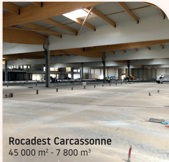
Rocadest Carcassonne 45 000 m 2 - 7 800 m 3