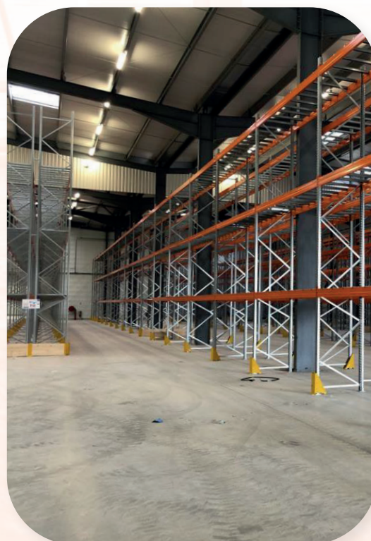
Usine Arterris Castelnaudary 4 200 m 2