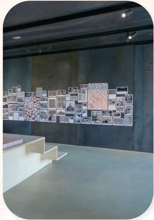
Musée Nègrepelisse (82)