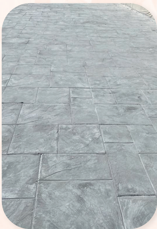
Terrasse Limoux (11)

De part sa finition structurée, le béton marqué est anti glissant et antidérapant, puis il est protégé en surface par une fine couche de résine incolore.