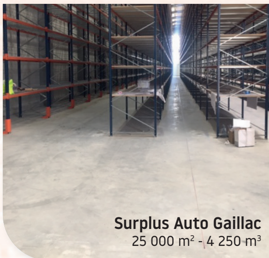
Surplus Auto Gaillac 25 000 m 2 - 4 250 m 3