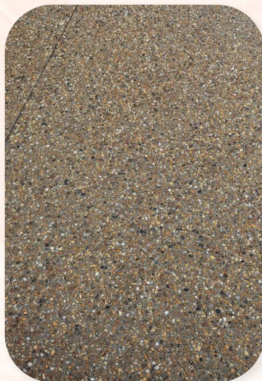
Allée carrossable Agde (34)